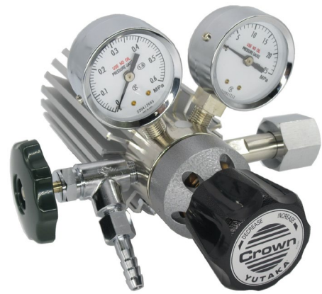
ストップバルブ付タイプ